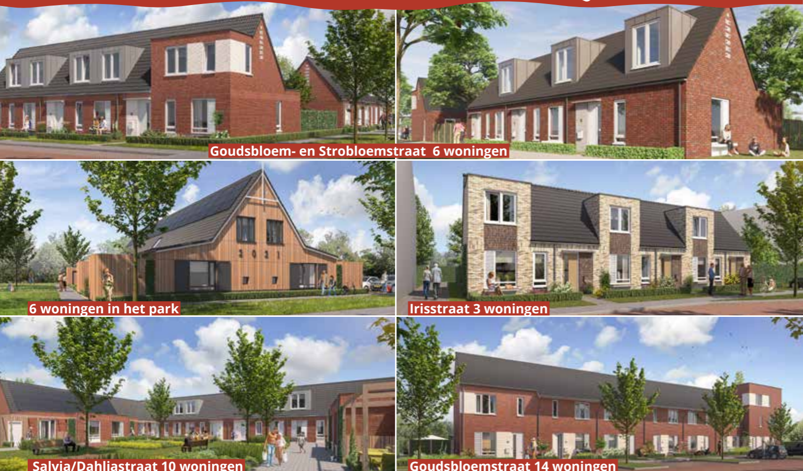
Goudsbloem- en Strobloemstraat 6 woningen